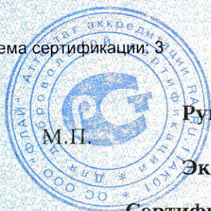
Схема сертификации: З